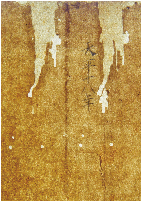
『金剛場陀羅尼經』「国（文化庁保管）」 第十九紙の透過光撮影

諮詢佛法錄 日本國城州興聖寺沙門圓在の慈經首和南 獻上疑問二十條請判是非 第一見性悟道請判是非 問北何是佛即心而佛三念是道祖三念心 是非能所言動念百思想心之法可得無 一行可修心本是佛佛亦是心也圓覺經曰 一切衆生本有圓成佛性若百物不思令念 純者若為自縛謂眼見也境心不染著 若為無念耳聞也境心不染著若為無 念但淨本心使六識從六根走出於六塵 中無染無著來去自由即是自在解 脫若無念行壇經曰若百物不思等 令念純即是法縛即若邊見云縛 首請判是非