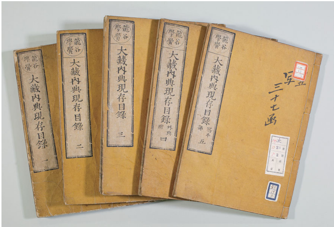
『龍谷学龔内典現存目錄』五冊 表紙 龍谷大学図書館蔵