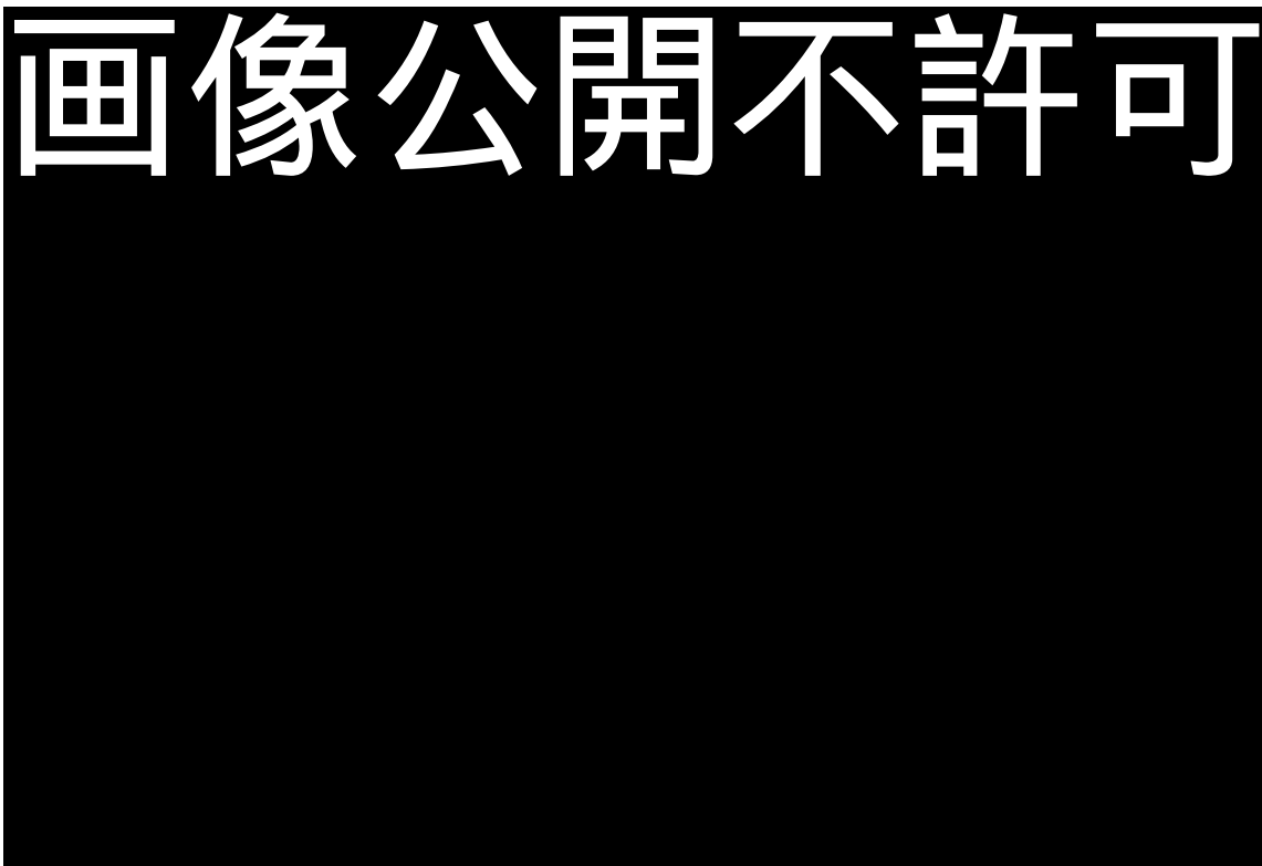
『大品經』卷第二十八殘卷（大谷探検隊将来）京都国立博物館蔵